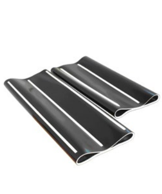
MASSEY FERGUSON POWERFLOW