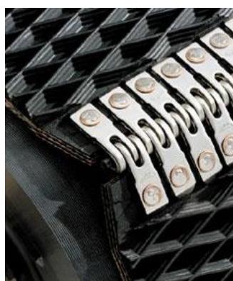
BÁLÁZÓ HEVEDER KAPCSOZÁSA