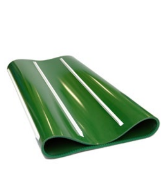
JOHN DEERE PREMIUMFLOW